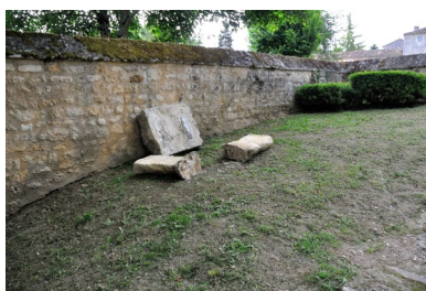
Lavoir du bourg