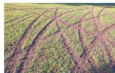
Terrain de football