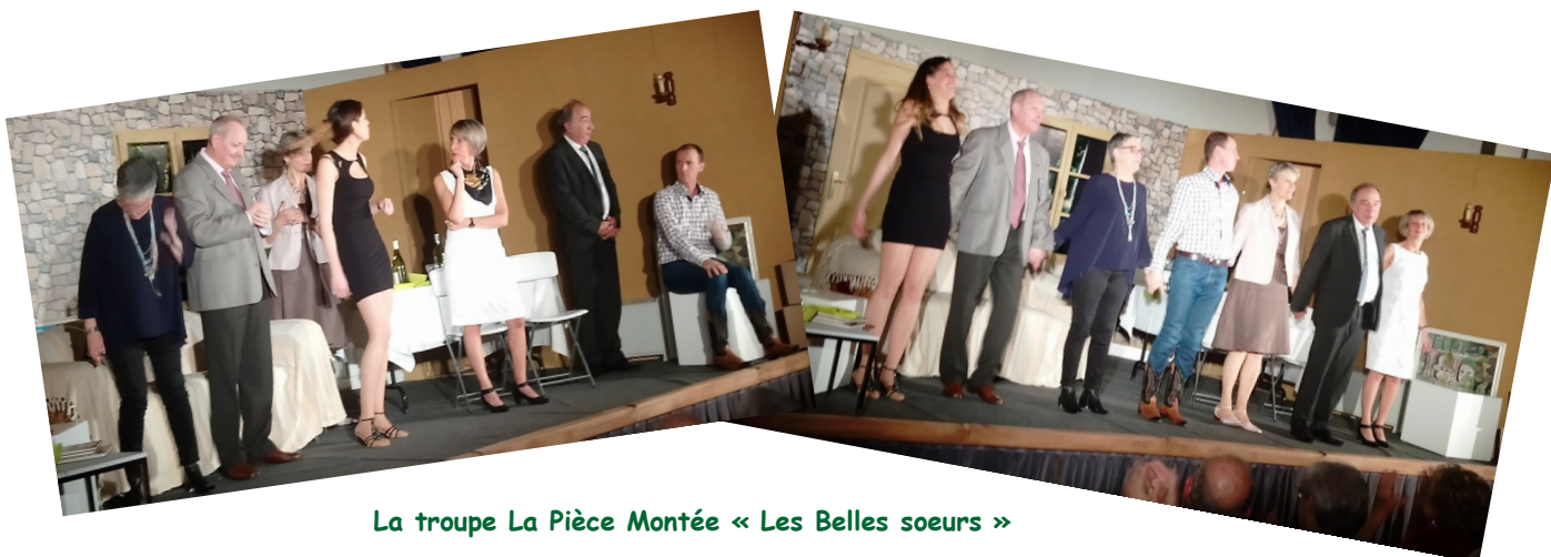
La troupe La Pièce Montée « Les Belles sœurs »

Le 10 février , soirée théâtrale avec la Pièce Montée en association avec la troupe des Riffauds qui nous a proposé « Les belles sœurs », une comédie pleine de gags et de quiproquos qui a bien fait rire les 125 spectateurs présents.