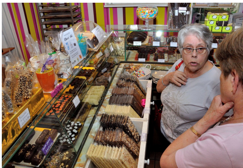
La chocolaterie d'Antan

- Une section loisirs : Elle fonctionne tous les mercredis de 14h à 17 h et réunit une quinzaine de personnes dans le local situé près du salon de coiffure. Plusieurs jeux sont proposés: cartes, scrabble, rumikub .