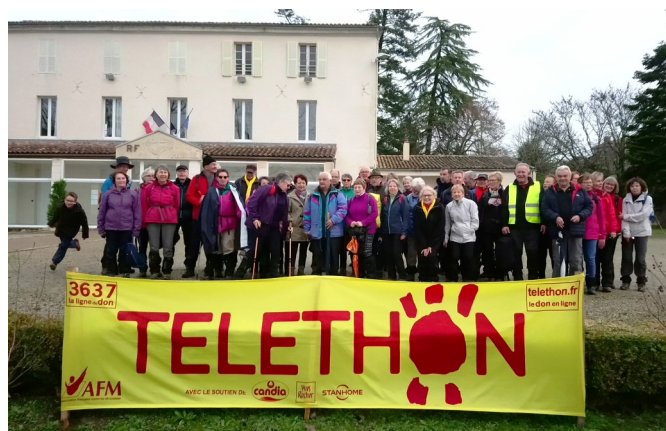
Journée « Téléthon »

Unis dans un bel élan de solidarité avec 45 randonneurs au départ de Sers et autant de sympathisants qui se sont retrouvés à midi à Bouëx pour partager un déjeuner élaboré par l'équipe du Comité renforcée par des personnes bénévoles mobilisés pour la circonstance.