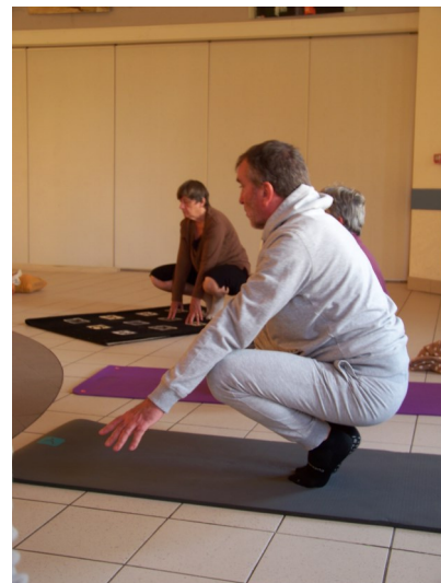
Séance de Yoga

Il y a eu également la projection d'une vidéo sur un voyage en Inde. Puis la présentation de vêtements traditionnels indiens : Le Dhoti pour les hommes, le Sari pour les femmes, le Pyjama et Kurta, c'est-à-dire pantalon souple et tunique longue en tissu assorti, la tunique rehaussée de broderies, de perles à l'encolure et au bas des manches, et au bas de la tunique elle-même. Le mot français « pyjama » vient de l'Inde : pantalon souple porté à la maison.