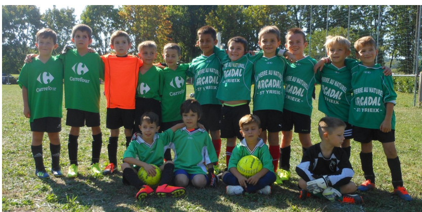
Equipe des débutants

Cette année encore, le club est représenté dans chacune des catégories avec en prime la présence d'une équipe U19 au niveau régional.