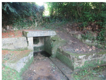
Lavoir de Chez Chagnaud

Régulièrement, les infrastructures et lieux publics de la commune font l'objet de dégradations. Outre les dépenses que cela occasionne et le temps passé par les employés communaux à la remise en état, on ne peut s'empêcher de se questionner et de se désoler. Naturellement, la gendarmerie est systématiquement prévenue et un dépôt de plainte est effectué à chaque fois par la commune.