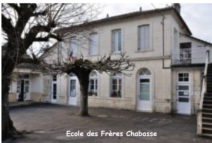
Ecole des Frères Chabasse