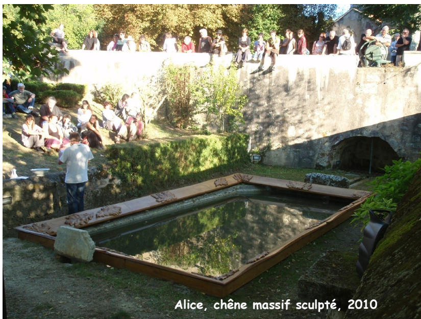
Alice, chêne massif sculpté, 2010