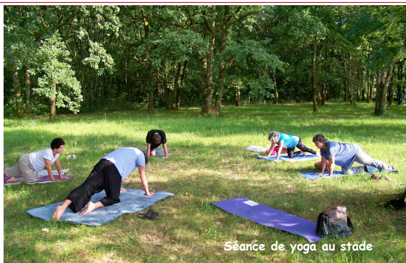
Séance de yoga au stade

Reprise des cours de yoga le mardi 15 septembre . Notre président a cherché et trouvé, pendant l'été une salle qui soit disponible pour accueillir notre groupe et pas trop éloignée de Bouëx ; il a trouvé à Dirac 'l'Épiphyte » qui est une école d'art du GrandAngoulême. Dans la nature et tout près des arbres, comme la salle des fêtes de Bouëx.