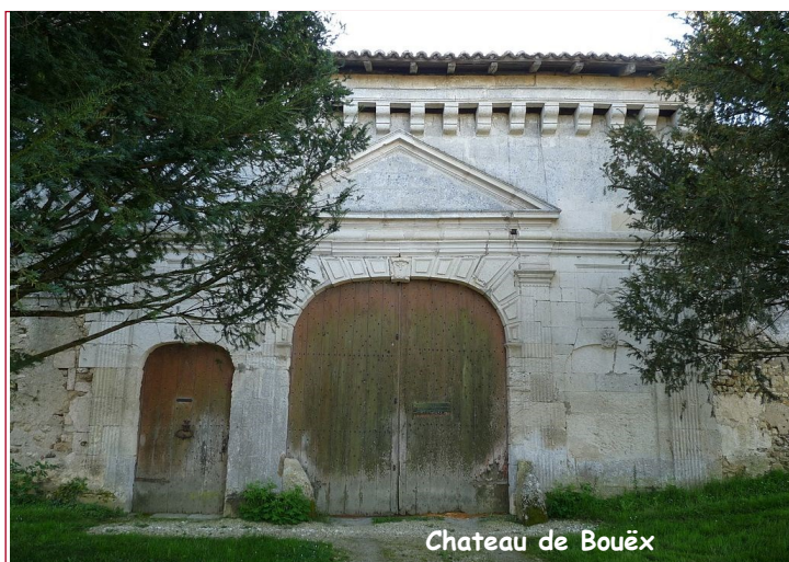
Château de Bouëx

Le château est inscrit à l'inventaire des monuments historiques depuis 2009, ainsi que l'église qu'il jouxte. Propriété privée, on ne peut pas le visiter.