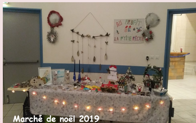
Marché de Noël 2019

L'équipe de l'association des Parents d'élèves