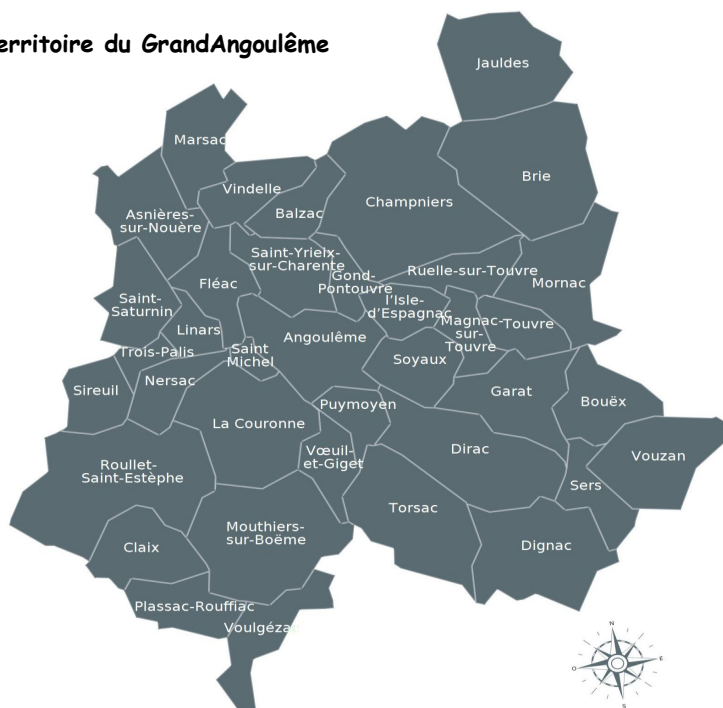
Territoire du GrandAngoulême

Elle est signée par chaque membre du Conseil de Développement qui s'engage pour 3 ans renouvelable une fois. Les membres du Conseil de Développement ne doivent pas avoir de mandat électif dans une collectivité locale ou territoriale.