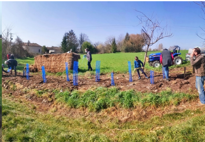
Petits et grands participent à la plantation

Comme nous vous l'avions annoncé, des haies ont été plantées sur la commune.