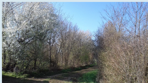
Haie plantée en 2000