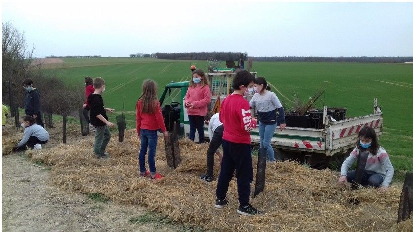
Les élèves de l'école sont venus une deuxième séance pour pailler...